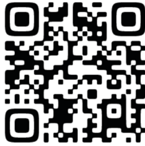
受講・制作・環境