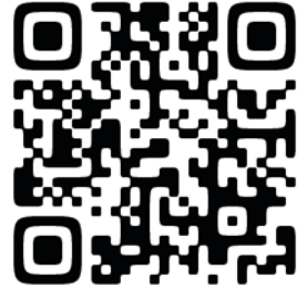
お申込後のご案内